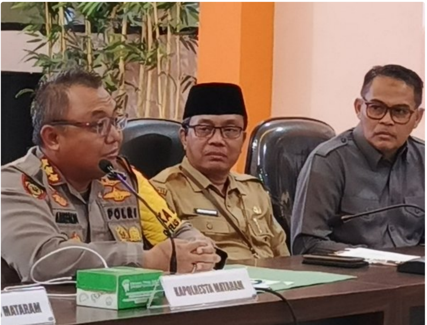
Kapolresta Mataram (Kiri) saat memimpin Konferensi pers akhir tahun, Selagi (31/12/2024)

MATARAM, NTB – Polresta Mataram mengakhiri tahun 2024 dengan menggelar Konferensi Pers Akhir Tahun, sebuah forum transparansi untuk memaparkan